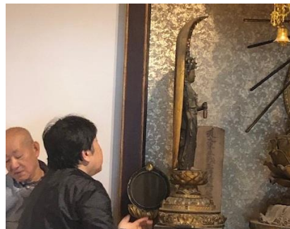
↑平安時代の作と判明した十一面観音立像 光背の裏書に江戸時代に修理されたことが判った