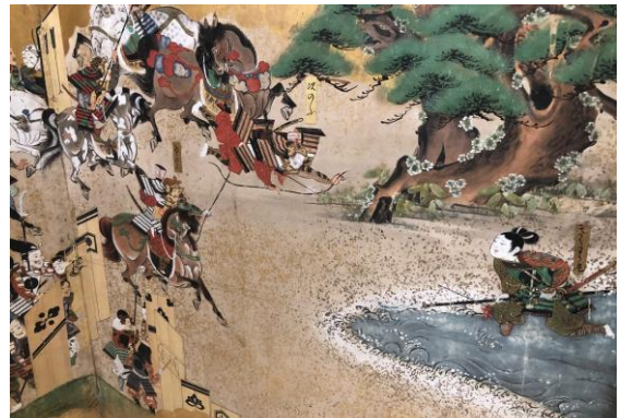
中央左：特別公開に合わせて展示された「源平合戦図屏風」 （赤間神宮所蔵・江戸初期）