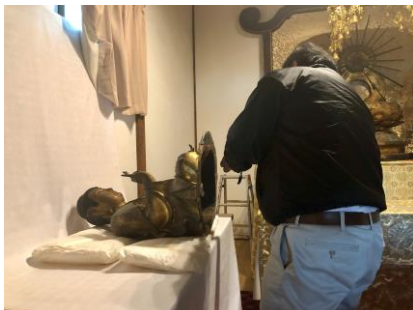
→本尊の胎内を確認、撮影し内部の木の組み方から制作年代を明らかにします