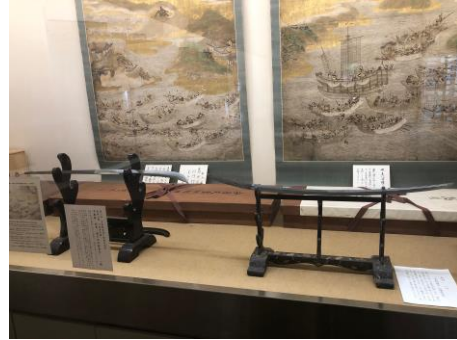
↑主従の太刀と長刀が平家終焉の地壇ノ浦で並び展示された。左：菊王丸所持長刀（六萬寺所蔵） 右：平教経公所持太刀（赤間神宮所蔵）

赤間神宮にて開催された第二回平家物語巡り法要祭において、六萬寺所蔵の「菊王丸所持長刀」が特別公開されました。赤間神宮は安徳天皇の御陵をはじめとした平家一門の墓所であり、菊王丸の主君であった平教経公の墓も七盛塚と呼ばれる一門の墓碑の中にあります。屋島の戦いで討ち死にし、教経公に壇ノ浦までお供することができなかった平家の童武者、菊王丸の長刀を八百五十年の時を超えて、教経公の太刀と