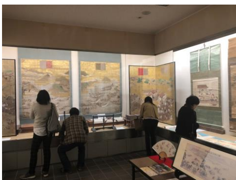
左：当日は六萬寺住職、副住職が展示の解説をしました。下関をはじめ、山口県内、福岡市内からなどたくさんの来場者にお越しいただき、高松や屋島合戦の歴史に興味をもっていただくことができました。