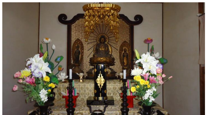
左：十一面観音立像 中央：本尊阿弥陀如来坐像 右：地藏菩薩立像