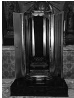
本堂に祀られている安徳天皇御尊儀(右)と鎮守社隣の安徳天皇生母徳子の碑(左)