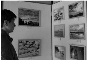
第1回 六萬寺学生写真展 31年1月26.27日

20名以上の学生さんが参加してくれました 27日は茶室で北高の初釜茶会も開催され、寒さ厳しい中たくさんの方が訪れました