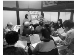
↑牟礼町お助け隊 (2年生)

今年から平家の揚羽紋にちなんで一緒に境内と学校でチョウを育ててくれています 2年生の授業には副住職がゲストティーチャーとして参加しました