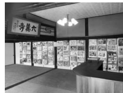
↑むれと蝶の絵コンクール (全学年)