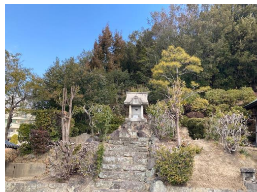
見通しの良くなった安徳天皇社

重要なお社ですが、生け垣が高く茂りほとんど見えない状態になっていました。今回バツサリと剪定し、鳥居周辺からもお社がよく見えるようになり、昭和の時代の写真で見える様子に近くなりました。また、六萬寺では成長しすぎた裏山や境内の樹木の剪定や伐採を行っているようです。